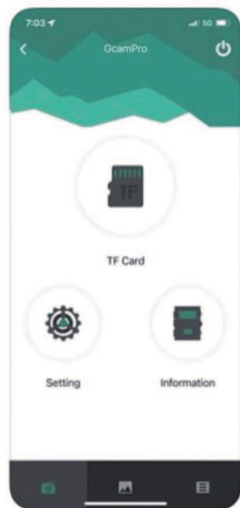
App Schaltfläche auf Ihrem Smartphone

Die Wifi App „Gcam Pro“ um die Kamera auch von einem Smartphone aus zu steuern, siehe Seite 8